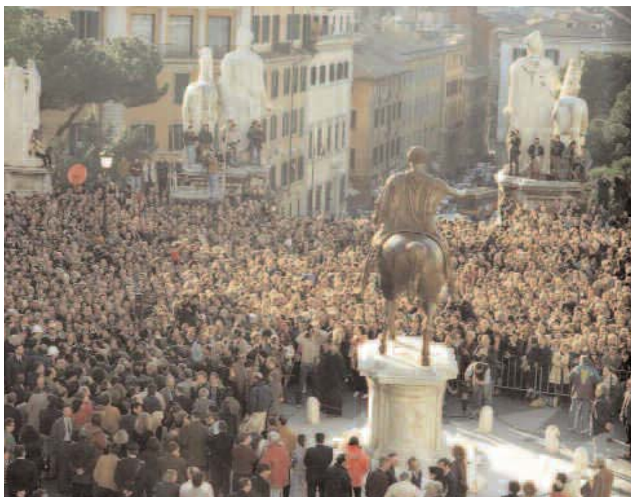
Dall'Archivio Fotografico del Campidoglio, le immagini della cerimonia del 1963 e il ritorno del Marco Aurelio sul colle il 21 aprile del '97

Venti anni dopo, il 21 aprile 1929, su Il Giornale d'Italia la lista degli incontri per i festeggiamenti è piuttosto nutrito. Tanto per avere un'idea: «Alle ore 8 sarà aperto al pubblico il Parco al Colle Oppio; alle ore 16 apertura della zona archeologica al Largo Argentina che alla sera verranno artisticamente illuminate; alle ore 18 il professor Munoz del Governatorato illustrerà le scoperte archeologiche; alle ore 17 inaugurazioni dei lavori eseguiti alla Tomba degli Scipioni».