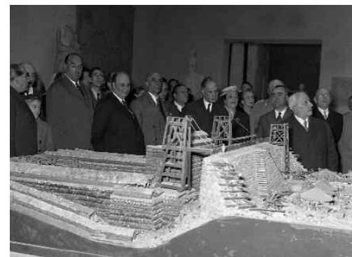
Per il Natale di Roma del 1955 è stato inaugurato il Museo della Civiltà Romana all'Eur. Queste immagini dell'Archivio Fotografico, come quelle della pagina precedente, sono tra le selezionate per la mostra al Vittoriano e tratte dal volume di prossima pubblicazione curato dall'Ufficio Stampa del Comune

decennio dopo decennio, ricompongono il patrimonio frammentato delle identità presenti nella Capitale e ognuno può riallacciare i fili della sua memoria e appartenenza ma anche prendere coscienza di realtà cittadine finora sconosciute.